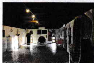
Ausstellung rumänischer Volkskunst (Botschaft Rumäniens in Australien)